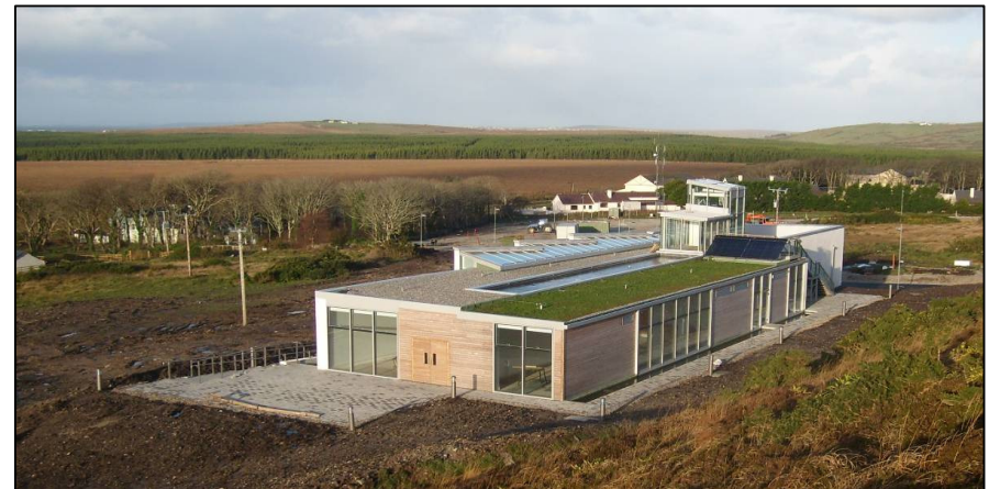
An tIonad Cuairteoirí sa Pháirc Náisiúnta i mBaile Chruaich.

Tá Cod Steak Ltd. ag tabhairt faoi dhéanamh na dtaispeántas léirmhínte. Ba chóir go mbeadh an obair seo críochnaithe agus curtha isteach faoi dheireadh mhí an Mháirta.