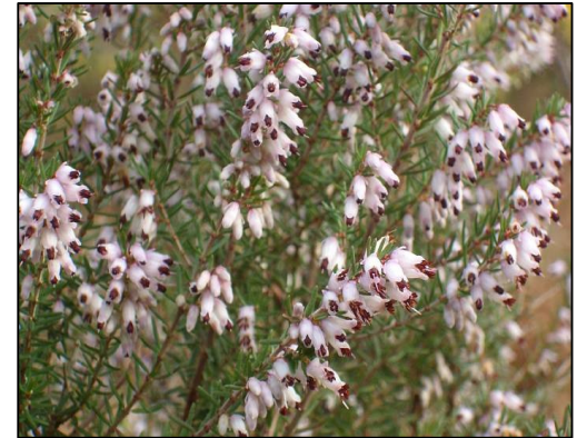
Fraoch camógach ( Erica erigena )

Fraoch – Is iomaí duine nach gcuimhníonn ach ar aon phlanda amháin nuair a luaitear fraoch. Tá trí fhraoch choitianta ar an mbratphortach atá sa limistéar. Fraoch mór ( Calluna vulgaris ), Fraoch cloigíneach ( Erica cinerea ) agus Fraoch naoscaí ( Erica tetralix ). Is iondúil go mbíonn na cineálacha seo fraoigh faoi bhláth ó Iúil go Meán Fómhair. Is iad bláthanna an fhraoigh naoscaí is túsce a osclaíonn, agus blátha an fhraoigh chloigínigh ina dhiaidh sin agus blátha an fhraoigh mhóir ina dhiaidh sin arís. Ní hé an t-achar céanna a mbíonn na cineálacha éagsúla fraoigh faoi bhláth agus téann an séasúr i bhfad rud a théann chun leasa na bhfeithidí. Is maith leis an bhfraoch naoscaí fás ar imill fhliucha na bportach, is maith leis an bhfraoch cloigíneach áiteanna níos tirime agus is maith leis an bhfraoch mór áiteanna tirime freisin, na tortóga caonaigh de ghnáth.